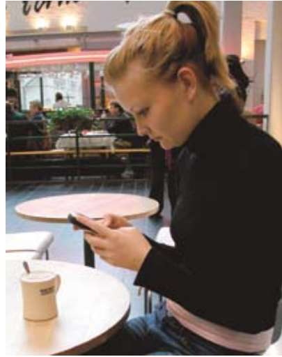
Mobiili tekniikka hävittää työn ja vapaa-ajan rajat. Mutta kännykän voi myös sulkea.

- Työ asettaa kovia tavoitteita, mutta niitä asettaa myös ihminen itse. Oma arvo lasketaan sekin materiassa. Jatkuva kilpailu tuo joitakin etuja ja terveitä uudistuksia, mutta kun se menee liian pitkälle, ei sillä enää ole positiivisia vaikutuksia.