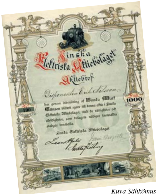
Kuva Sähkötalo Elektra